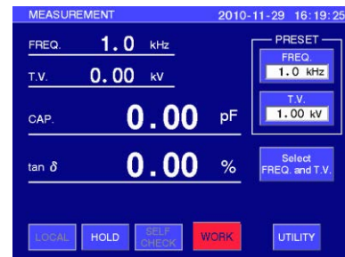
DAC-HFM-1 液晶タッチパネル