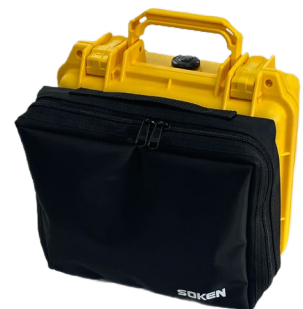
持ち運びしやすい ポータブルデザイン